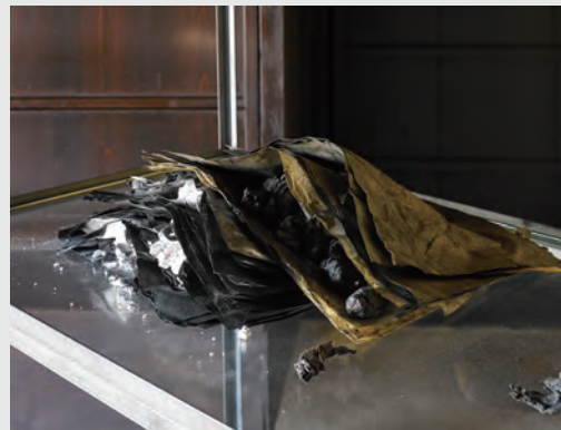
「Sheaf and Stalk #4, (detail)」