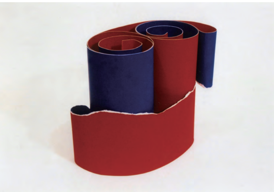
「ひとつづきの平面」

2001年 両面を塗り分けただけの紙 30(w)×15(d)×24.5(h)cm 東京都現代美術館蔵