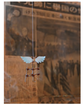
「天使の椅子」(部分) 竹・紙・銅線 2000~2010年