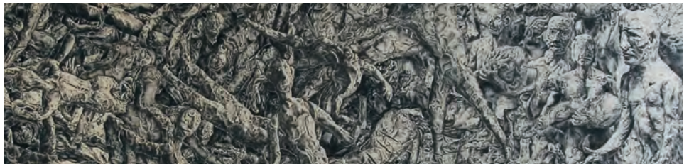
「歴史は死者がつくった」(部分) 烏ノ子紙にインク 2000~2009年

展覧会の内容を説明するよりは先づはそこに立ち 皆さんが体感していただけたらと思います。